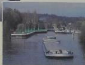
Les ouvrages de l'Isle-Adam au début du XXI e siècle