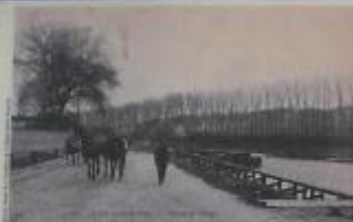
Le halage par chevaux

Depuis toujours, les hommes ont trouvé sur les cours d'eau une voie de communication naturelle. L'utilisation du courant, la voile et les rames furent les premiers moyens de navigation. On utilisa ensuite l'énergie humaine et animale. Le marinier pouvait haloter* lui-même son bateau ou recourir à la traction animale. Le halage à l'aide des chevaux (photo ci-contre) subsista jusqu'entre les deux guerres au 20 ème siècle.