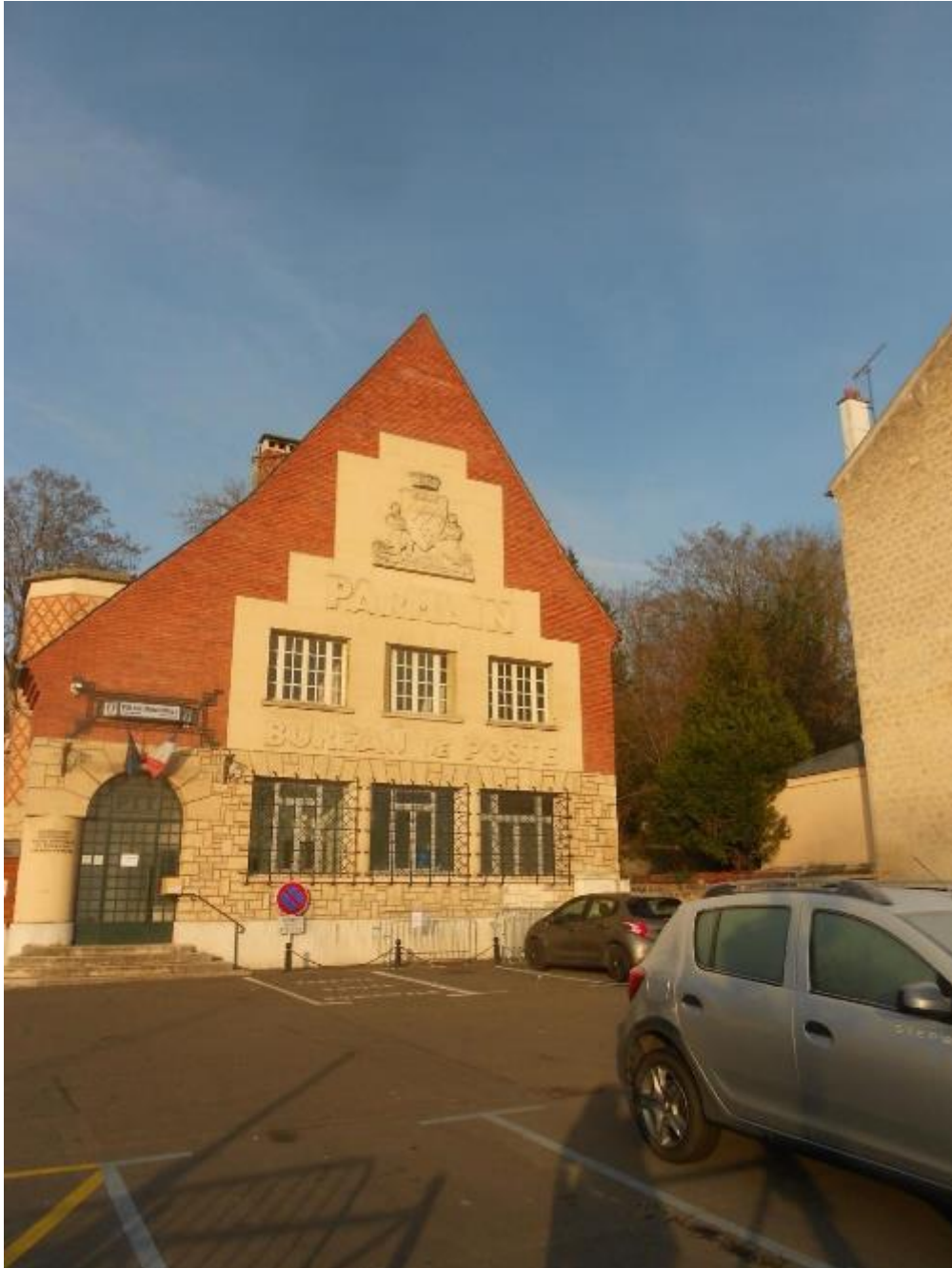
Architecte : Georges Labro - Briques et béton (1932)