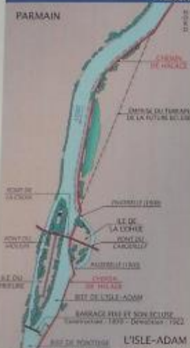
Planche N°1 :

Avec le développement industriel et l'exploitation de la houille au 19 ème siècle, la canalisation* de l'Oise devient une nécessité. Un barrage fixe et son pertuis sont livrés à la navigation en 1832.