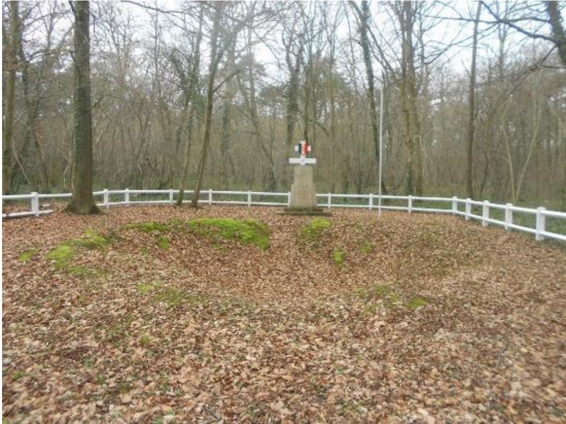
Monument en hommage aux résistants fusillés en 1944 dans la forêt, à cet endroit précis