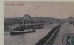
La navigation à l'Isle-Adam de 1902 à nos jours

A terme, les barrages implantés sur la rivière d'Oise seront remplacés par des barrages automatisés*.