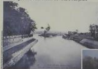
Les ouvrages de l'Isle-Adam au début du XX e siècle

Barrage automatisé : barrage permettant une manœuvre simple, sécurisée et rapide. Il garantit une gestion plus réactive et plus fine de la ligne d'eau.