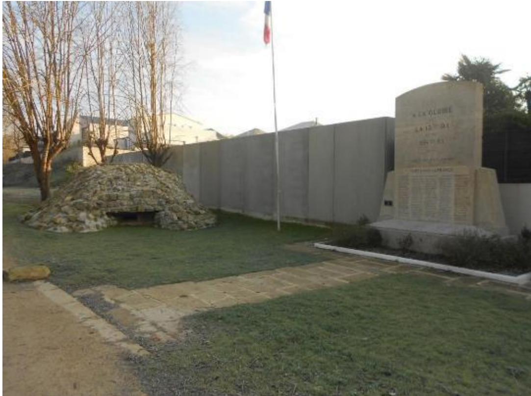
Monument aux morts