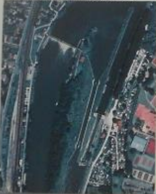
Photographie aérienne du site