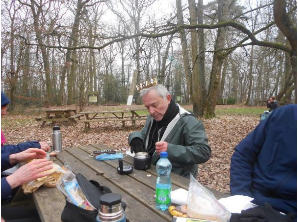
Notre guide suprême est devenu roi (mais il reste démocrate)