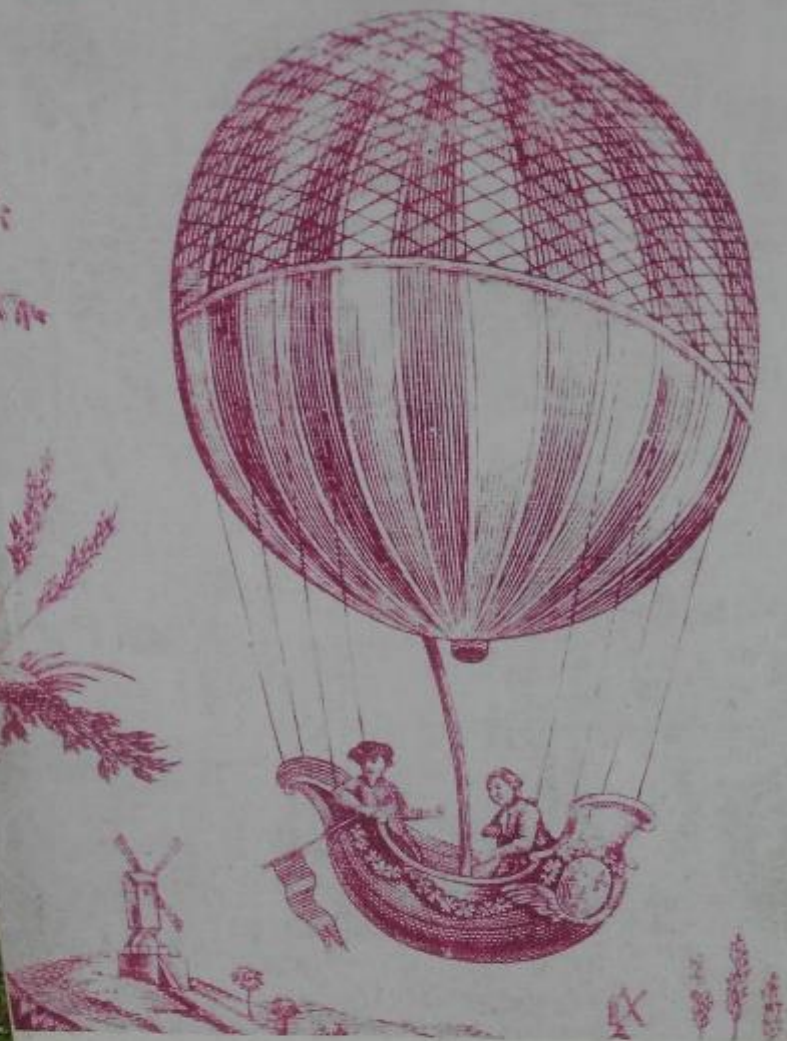
Toile de Jouy Le ballon de Gonesse 1784