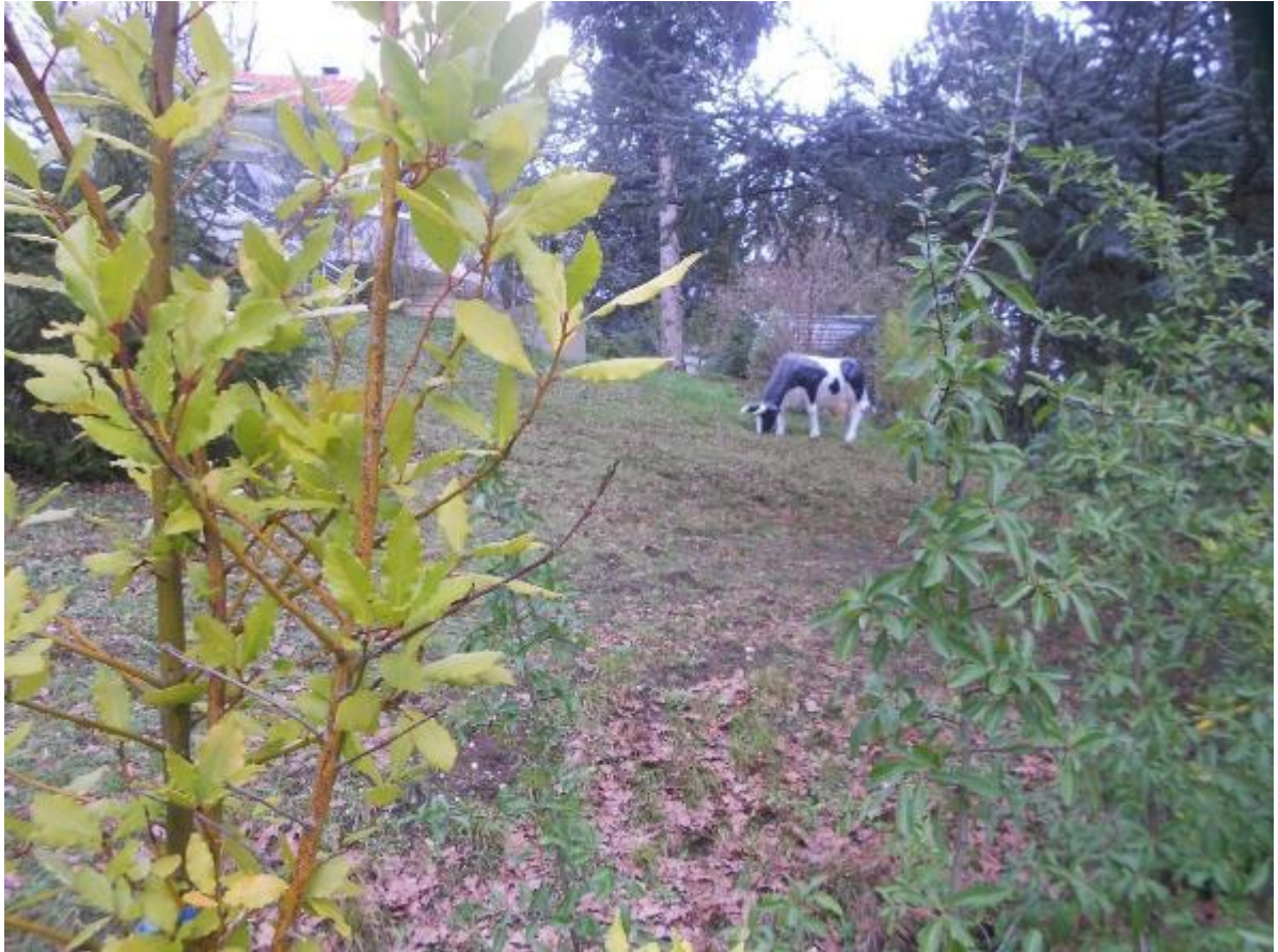
La vache est fausse mais pas le pré