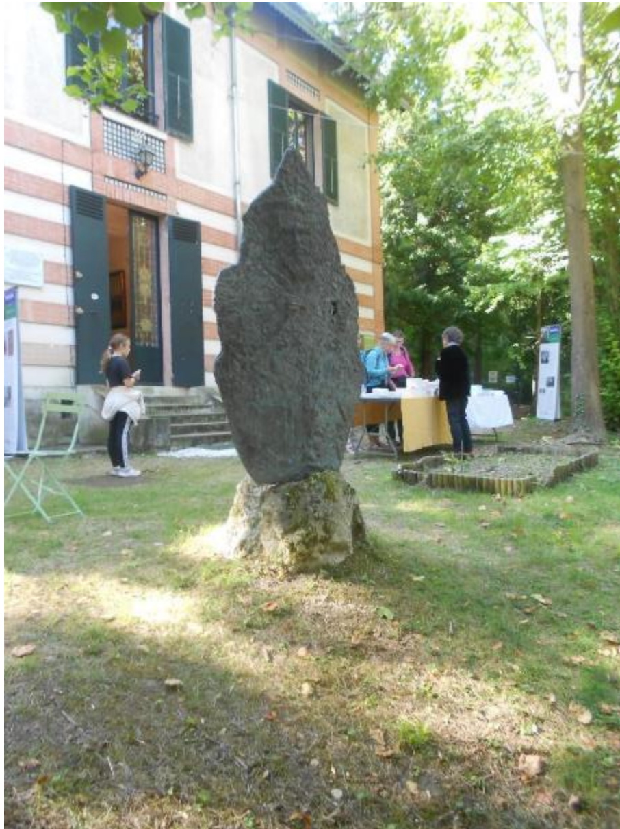
La sculpture à deux faces (Viardot et Tourgueniev)

Pour celles et ceux qui veulent en savoir plus sur l'histoire de cette maison et du couple Tourgueniev/Viardot, écoutez l'émission de France Inter. Une heure dans l'intimité du "couple" Tourgueniev/Viardot - "la plus belle histoire d'amour du 19ème siècle" selon Maupassant https://www.radiofrance.fr/francemusique/podcasts/l-air-des-lieux/a-bougival-les-freneschez-ivan-tourgueniev-et-pauline-viardot-5081532 A voir également à Bougival