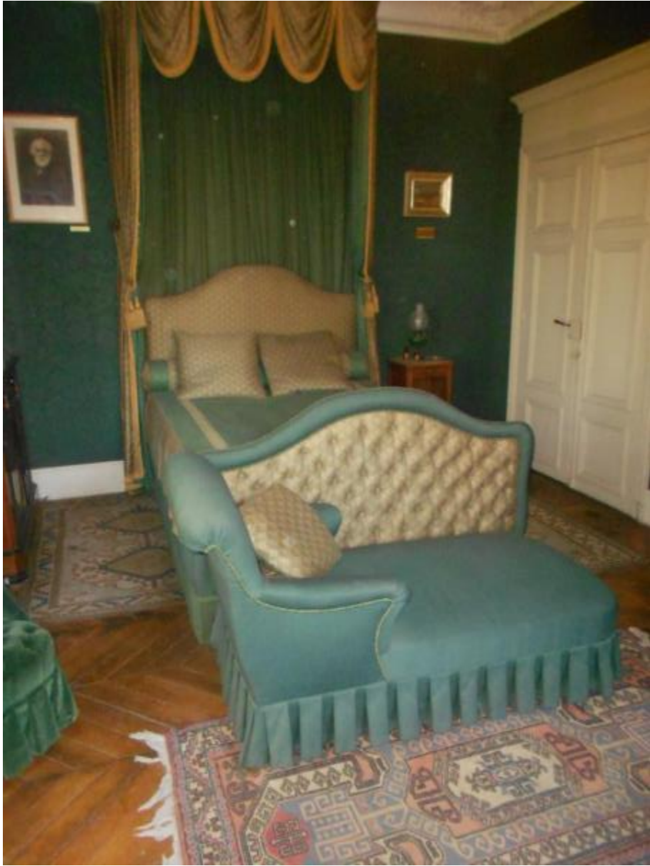
Le lit de Tourgueniev