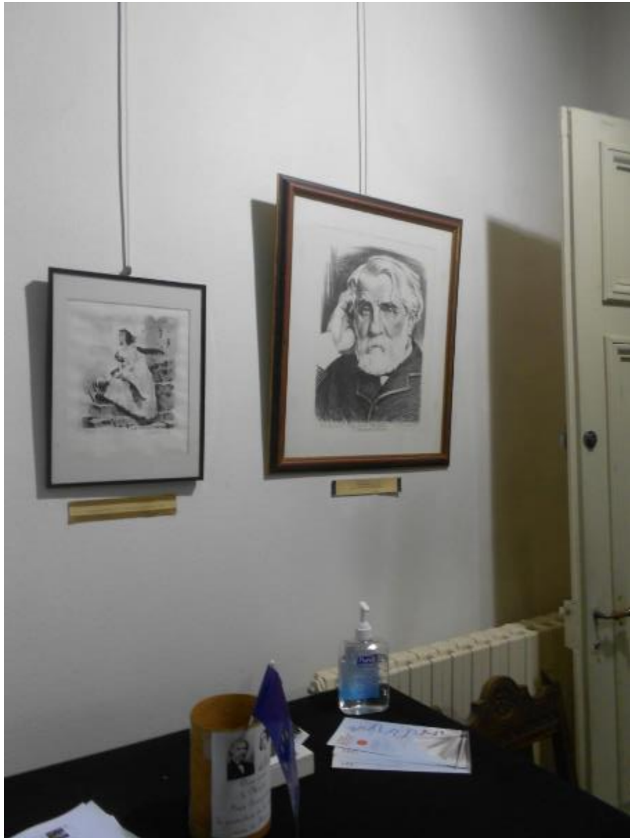
Portrait de Tourgueniev qui rappelle celui de Victor Hugo