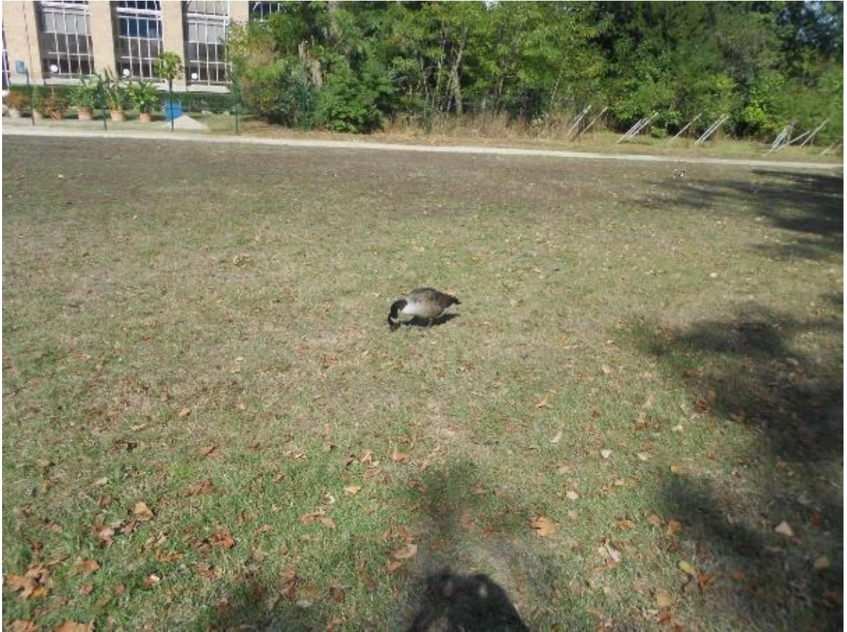
Cygne affamé mangeant des feuilles mortes