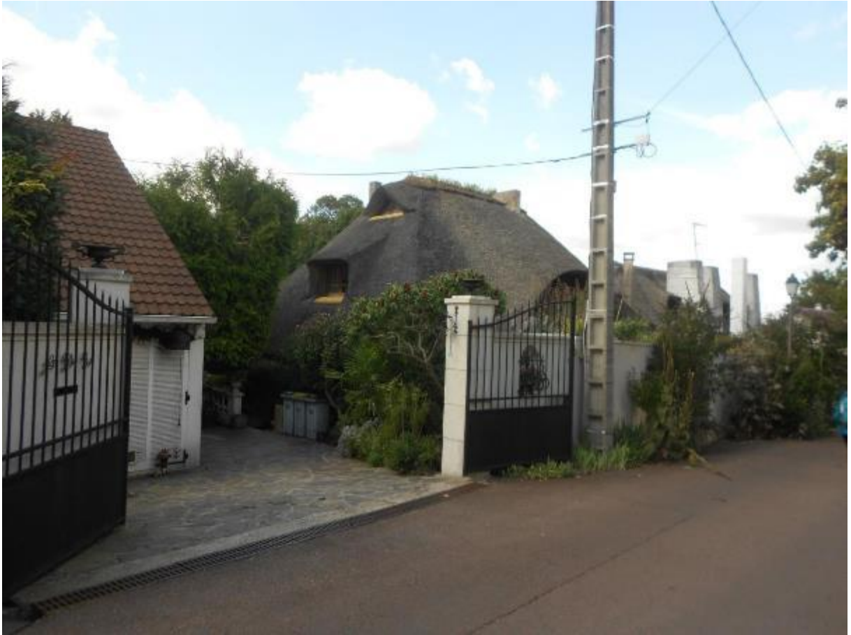
Une maison au toit de chaume dans le quartier résidentiel de Rueil-Malmaison