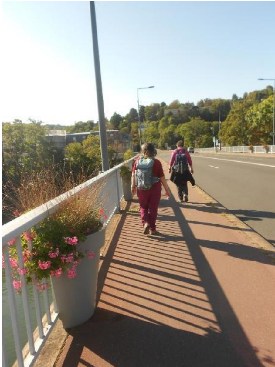
Traversée du pont de Rueil, un matin d'été