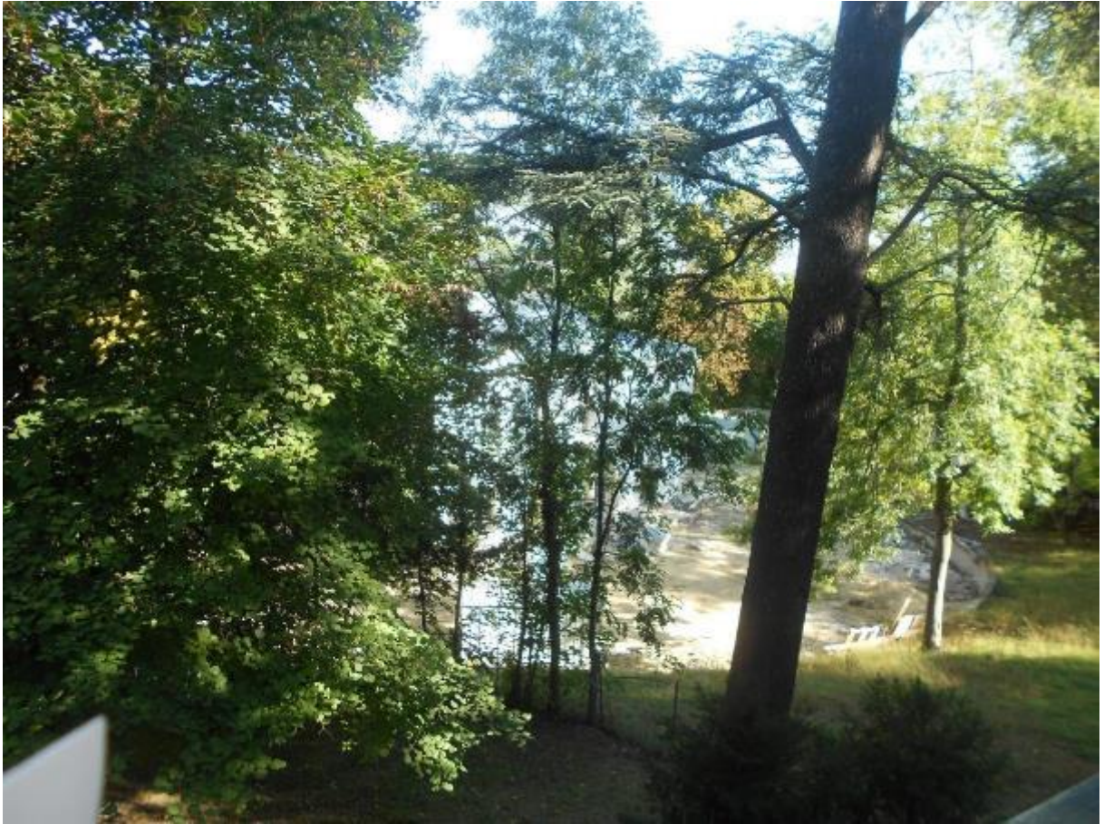
Point de vue à partir du balcon