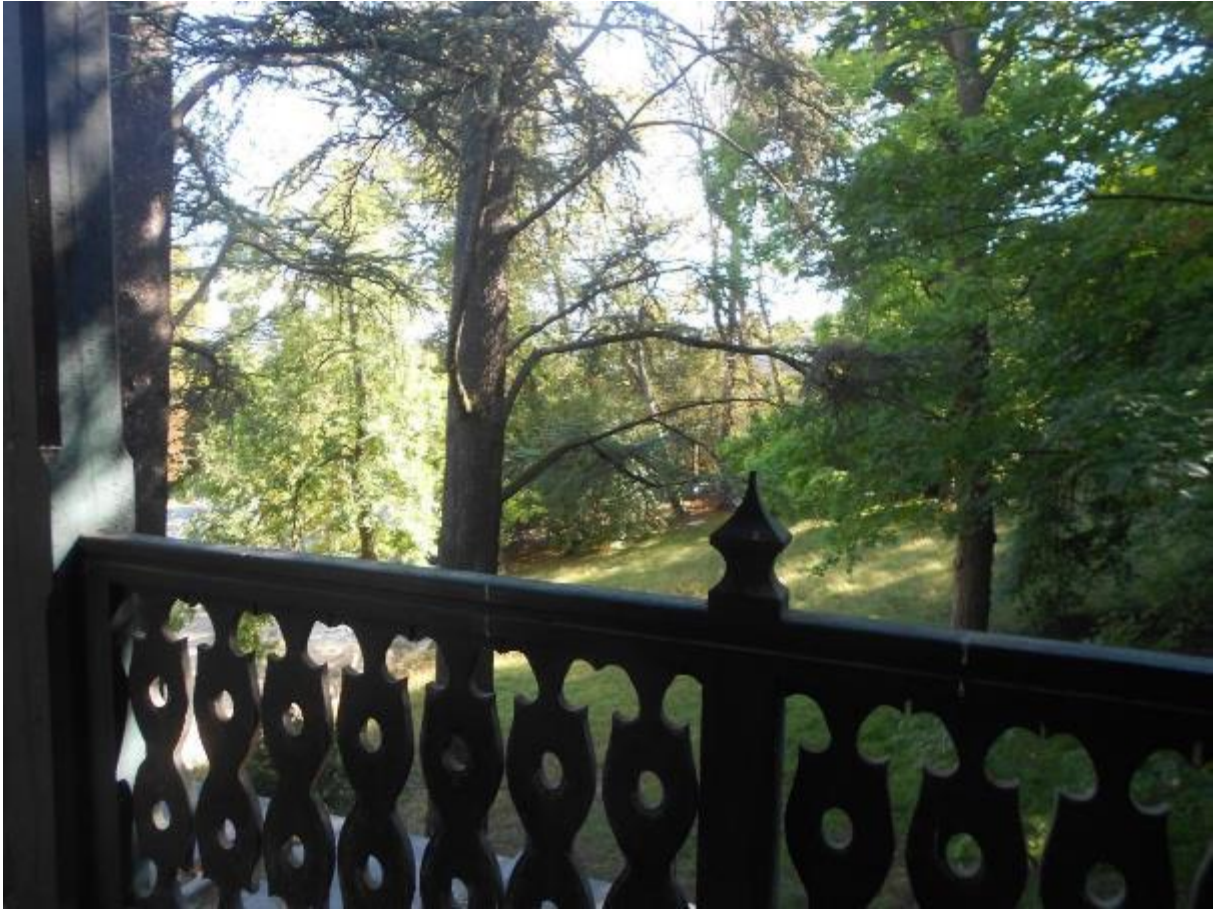
Point de vue à partir du balcon