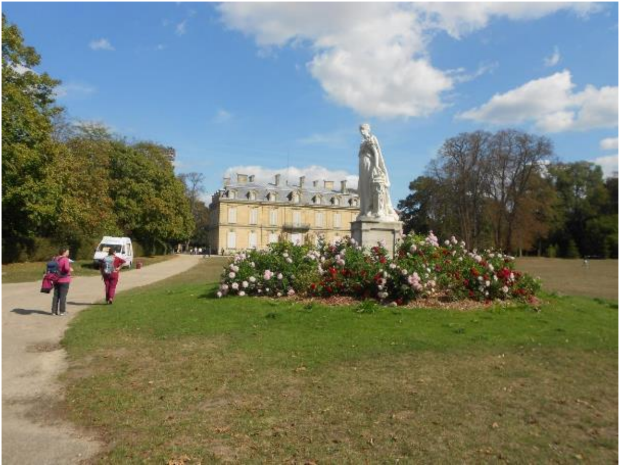
Statue de Joséphine en toute liberté bien qu'elle ait de beaux harnais