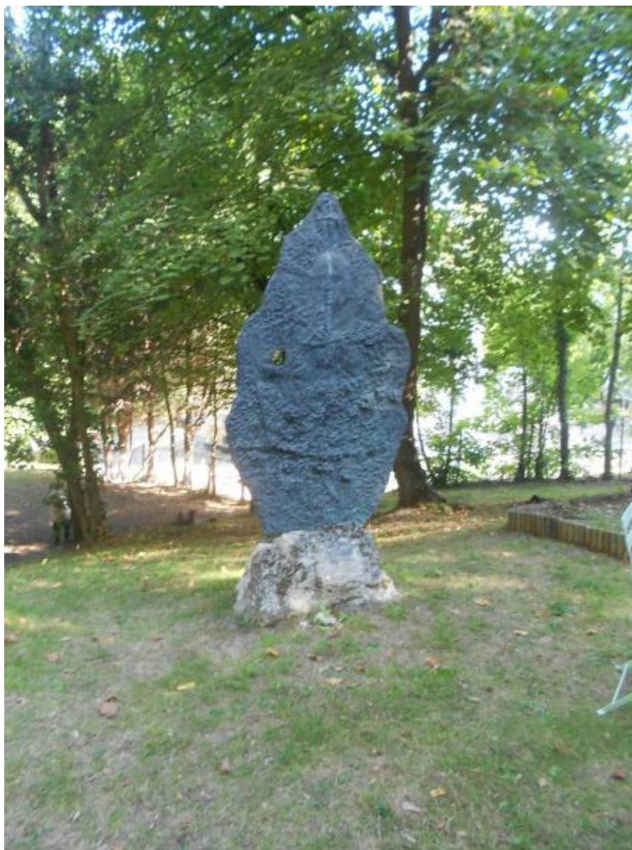
Pauline Viardot, la compagne de Tourgueniev

Au cours de notre visite, nous avons découvert la vie quotidienne de l'artiste, son piano, ses photos personnelles ainsi que sa chambre et son cabinet d'écriture. Un écrivain opposé à l'esclavage et à l'injustice. Une visite inédite et instructive pour les amoureux de la littérature !