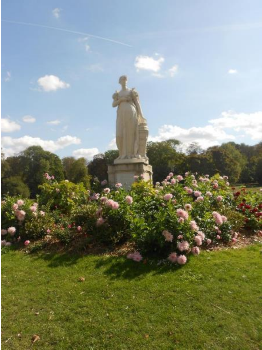
Joséphine parmi les dahlias