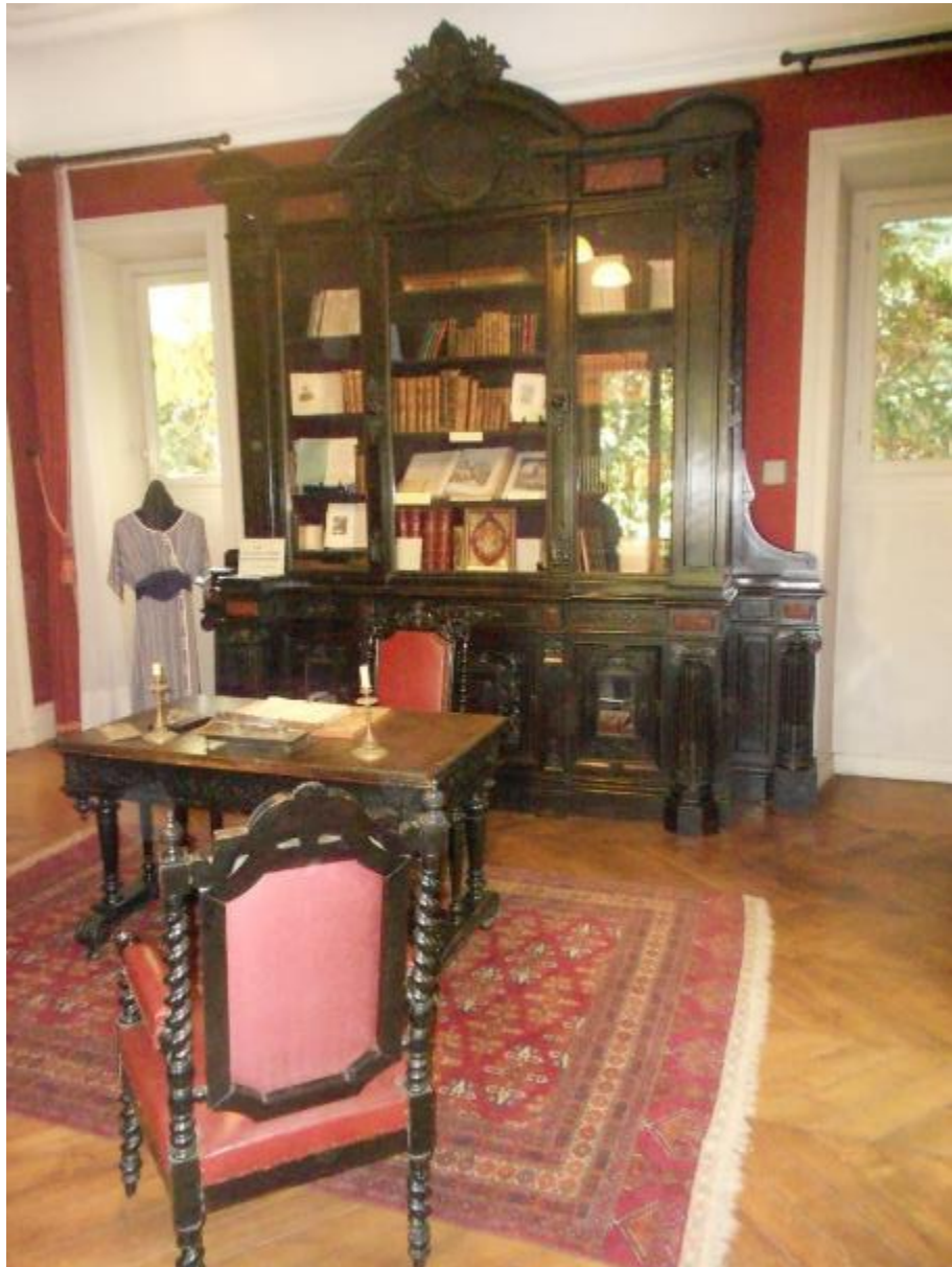
Le bureau de l'écrivain