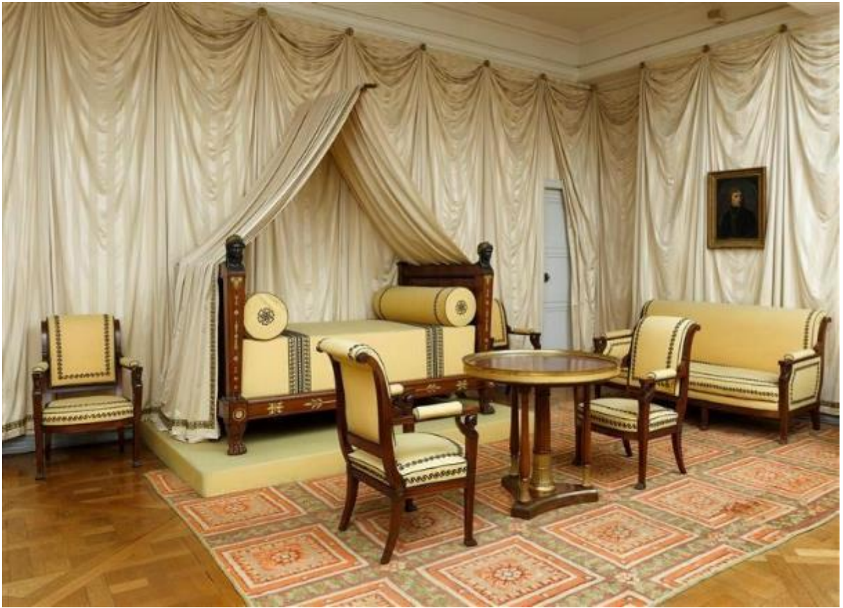
Chambre de Napoléon, le lit est tout petit...