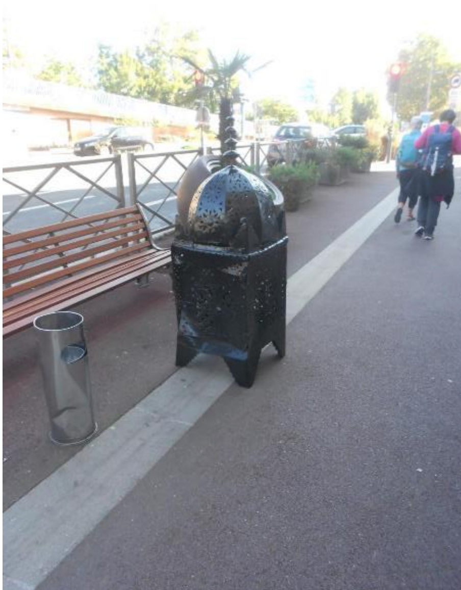
A Bougival, un objet insolite en face du restaurant marocain