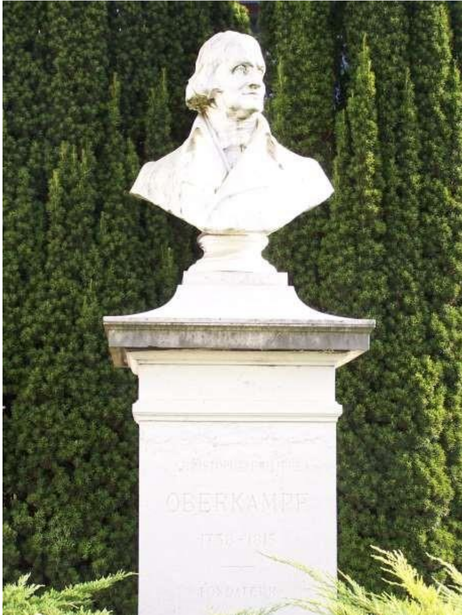
Buste d'Oberkampf devant la mairie