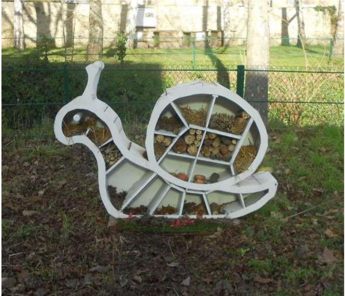
On a marché plus vite que lui