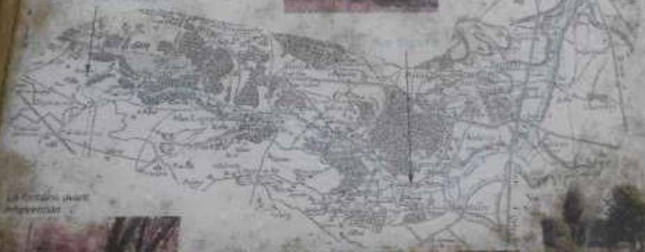
La Fontaine des Gobelins

Cette rivière coule sur une longueur de 10 km et se jette dans la Meuse à Sedan en 1547. Après l'arrêt de la Bièvre en 1667, la municipalité de Guyancourt a financé la construction de la Fontaine des Gobelins. Elle est classée monument historique en 1987 et est inscrite au Patrimoine mondial de l'UNESCO.