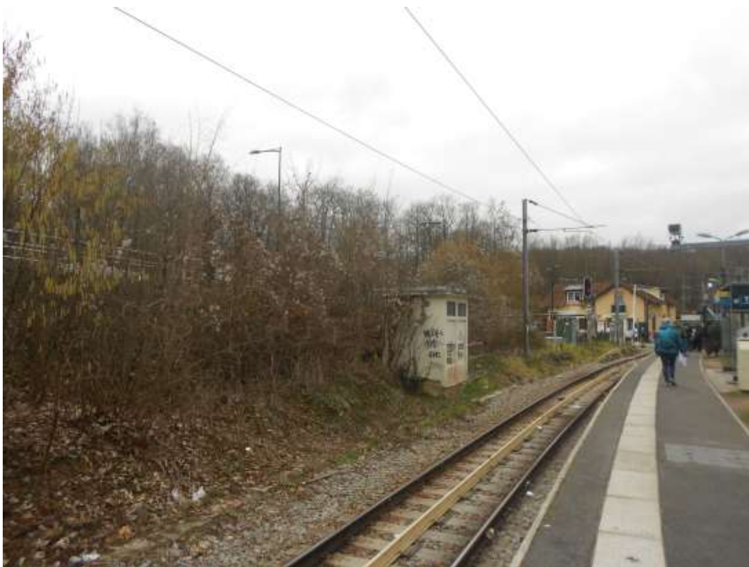
La gare de Saint-Nom-La-Bretèche a la particularité d'être près de la forêt de Marly

En revanche, le Chemin de fer de Grande-Ceinture fit constater l'éminence de ses services. C'est grâce à lui que l'on put satisfaire aux nécessités de notre stratégie. Pendant quatre longues années, il ne cessa point de faciliter, sans passer par Paris, le transport des troupes amenées perpétuellement d'un point à l'autre du front.