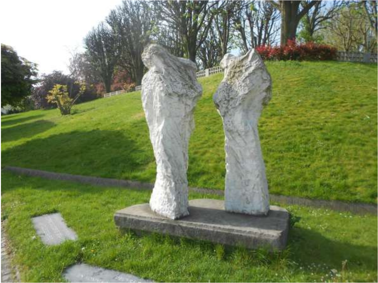
Hommage aux victimes de la guerre d'Algérie