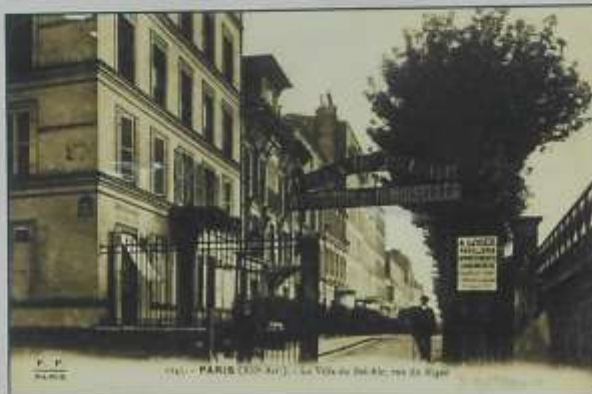
Paris (Bel-Air) - La Villa du Bel-Air, rue du Niger

Elle est bordée d'un seul côté de maisons de deux étages, agrémentées, devant les façades, de jardinets. Beaucoup ont été surélevées, détruites ou transformées en immeubles.