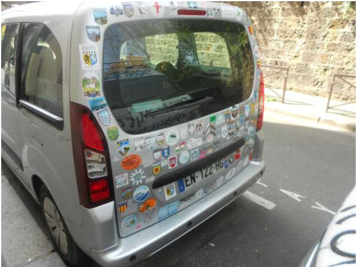
Un grand voyageur qui tient à le montrer !