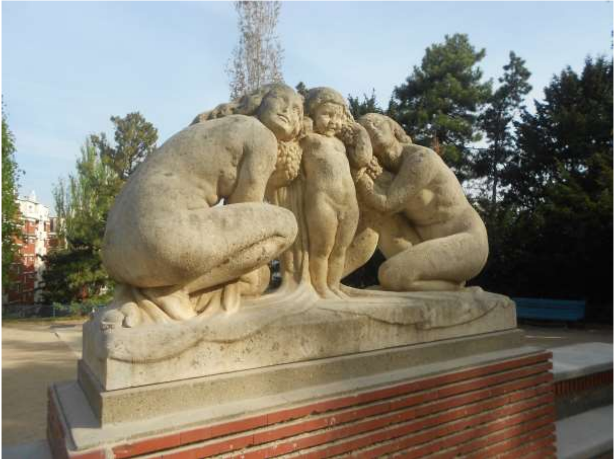
L'enfance de Bacchus (Patrick Traverse)