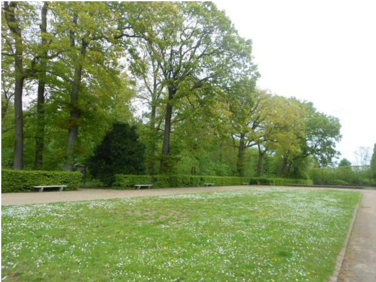
La place de la Mairie vers 1920