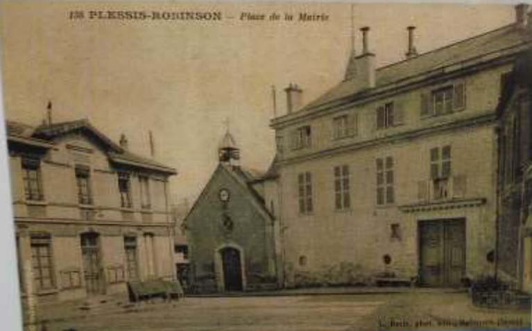
La place de la Mairie vers 1920

138 PLESSIS-ROBINSON — Place de la Mairie