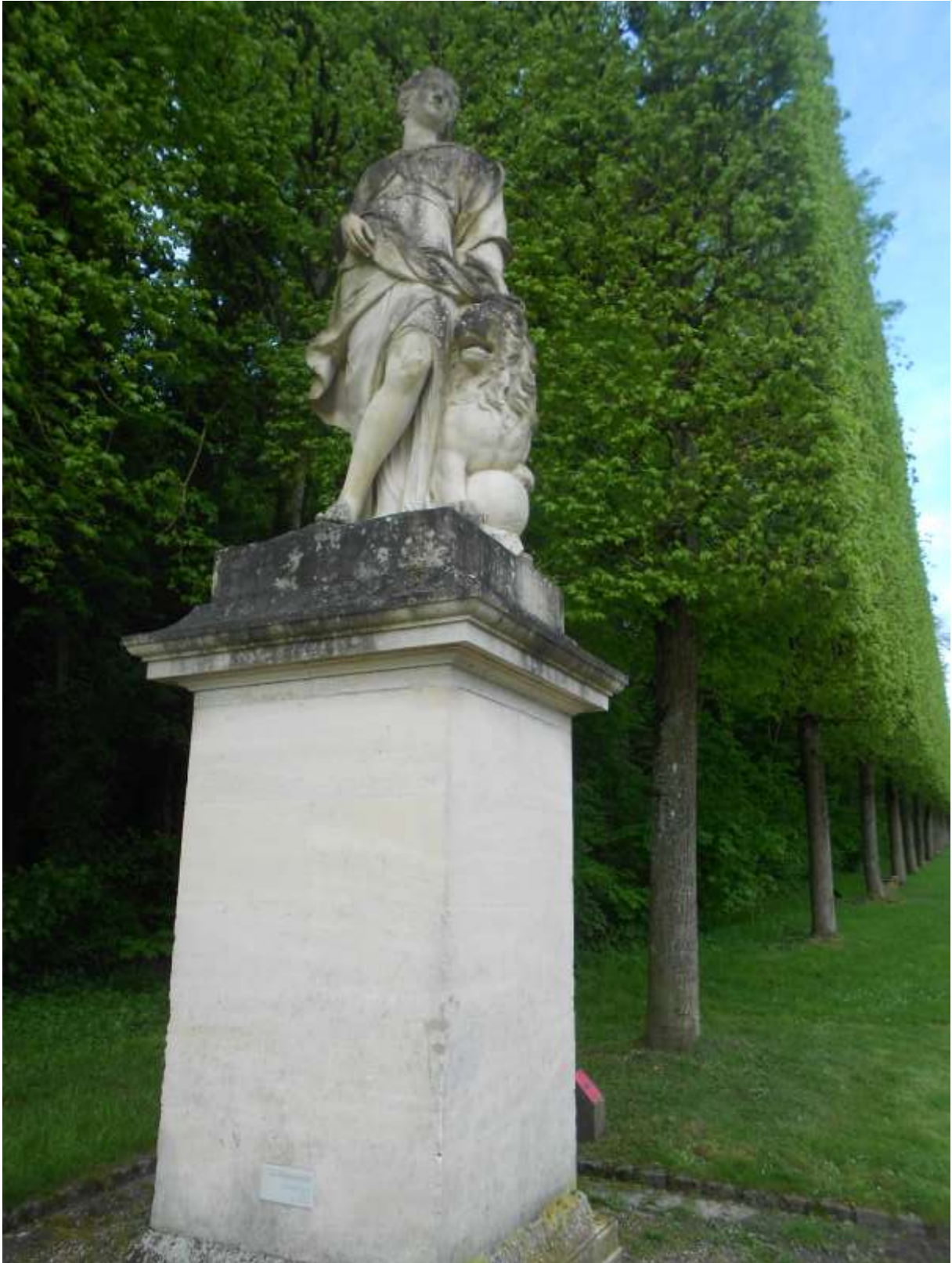
Statue de la magnanimité