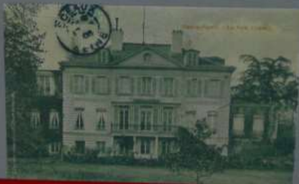
Le Petit Château vers 1900

À l'emplacement de la Cité de l'enfance s'élevait autrefois une charmante maison bourgeoise surnommée, par les habitants du Plessis, le Petit Château. Construite au XVIII e siècle, cette propriété était entourée d'un vaste parc à l'anglaise. Après l'acquisition en 1854 par Louis Hachette du château du Plessis-Piquet (actuel Hôtel de Ville), son gendre et associé Louis Bréton s'installa au Petit Château. Le Plessis vécut alors pendant près de 50 ans au rythme du monde de l'édition. La demeure abrita ensuite la retraite du baron Dos Santos, ministre plénipotentiaire du Portugal, avant de devenir, en 1916, la maison de campagne de Maurice Lewandowski, directeur du Comptoir National d'Escompte de Paris. Une rue située à la sortie du Bois de la Garenne rend hommage à sa fille, Marguerite, tuée en 1944 lors d'une mission de secours à des victimes de guerre. Le Petit Château, en très mauvais état, fut détruit en 1954, ce qui permit d'élargir l'avenue Général Leclerc et de construire la Cité de l'enfance.