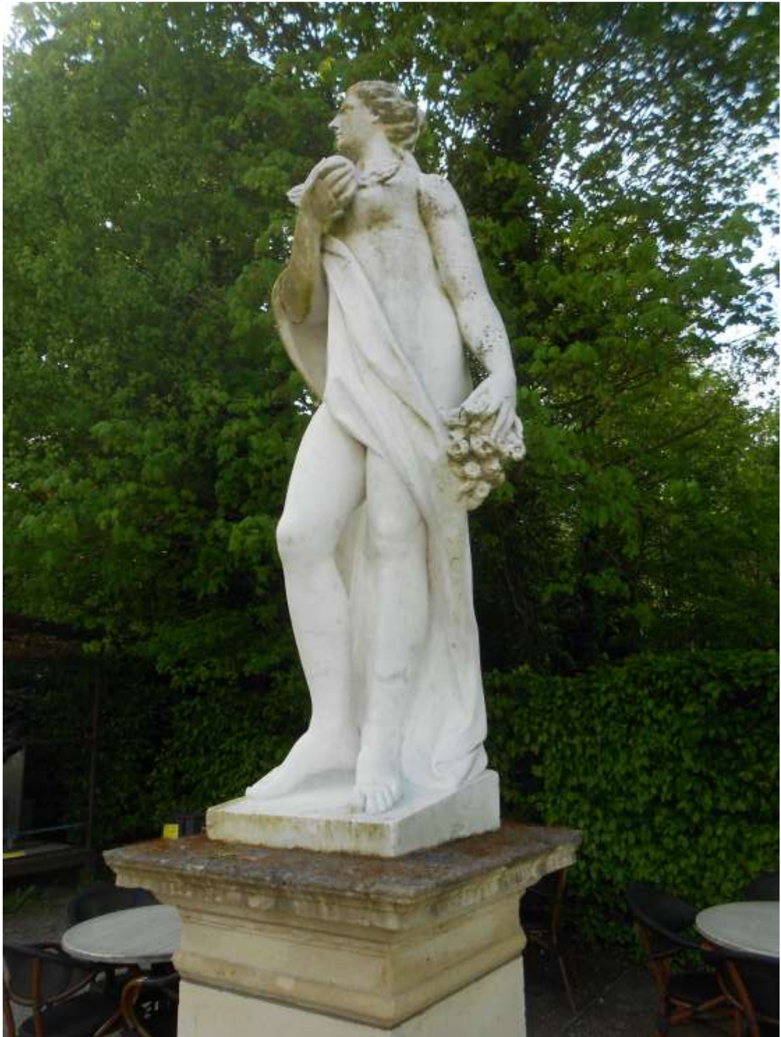
Allégorie de la Terre XVIII e siècle Marbre Inv. 37.29.8