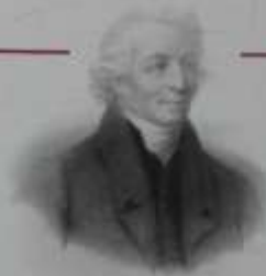
Frédéric-César de La Harpe

Le 13 mai 1814, le tsar de Russie Alexandre I er et ses frères quittent Paris pour quelques heures, abandonnant brièvement la table des négociations du traité de paix qui marque la défaite de Napoléon. Escortés de quelques cavaliers, ils se rendent discrètement au Plessis-Piquet pour y retrouver leur ancien précepteur, Frédéric-César de La Harpe (1754-1838), qui vit en exil au Petit Château depuis 1799. Ce brillant intellectuel suisse, choisi par l'impératrice Catherine II de Russie pour instruire ses petits-fils et les former au dur métier de roi, était devenu par la suite l'un des directeurs de la République helvétique avant d'être contraint de fuir en France. En 1815, il regagna la Suisse pour se mettre à nouveau au service de son pays natal, secoué par une profonde crise politique.