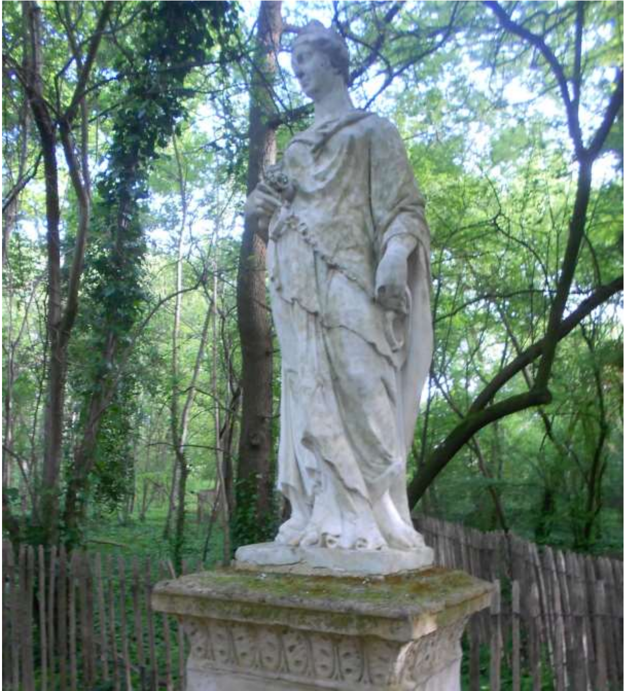
La Servitude XVIII e siècle Marbre Inv. 37.29.3